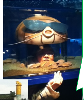
中華街にあるおもしろ水族館