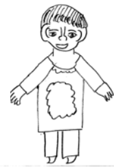
生活館のメンバーさんの個性溢れる作品づくりに少しでもお役に立てたら...