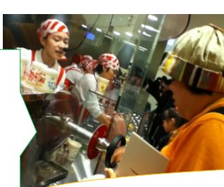
カップヌードル作りに挑戦

休日は予約でいっぱいになってしまうカップヌードル作りの体験に2組で出かけました。どんな味のカップヌードルが出来上がったのかは食べた人のみ知るところですね。