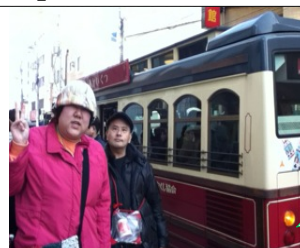
Vo.1 に続き、今回もお世話になった「あかいくつ号」。

2月後半～3月も「横浜方面おでかけ」が計画されています。アンパンマンミュージアムや新横浜ラーメン博物館という案が出ています。もう少し暖かくなったら山下公園周辺をお散歩するのもよいかもかもしれません。