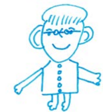
いつもありがとうございます。