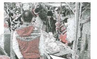
掘り出し物がいっぱいあるよ