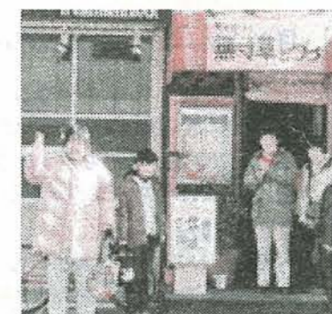
みんなで見学に行きました。ギャラリーエントランス

今回は、地元八王子を離れた都会での開催で、楽しみでもあり、ちょっぴり不安もありましたが、無寸草さんの常連さんをはじめ、窓からみえる織物に誘われて、お散歩途中に立ち寄ってくださる方あり、DMを頼りに八王子方面からみえてくださる方ありで、連日盛況でした。ほんとうに、うれしいことです。