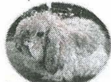
看板うさぎの ベルたん

とても元気で気さくなおばちゃん。朝夕あいさつを交わすのがお決まりのメンバーさんもいます。手をふるだけでも満足。季節や日々入れ替わるきれいな草花と、おばちゃんから元気をもらえる大事な憩いの場です。お互いに「がんばってね」といいあえる関係も大切にしたいです。お花は、たまにしか買わない(ごめんね)のに... サービスしてくれるのもとってもうれしい!